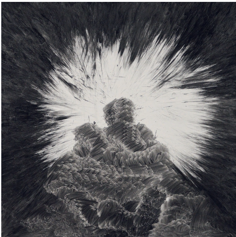
Gomolj, 2025. pastel, lak 100 x 100 cm