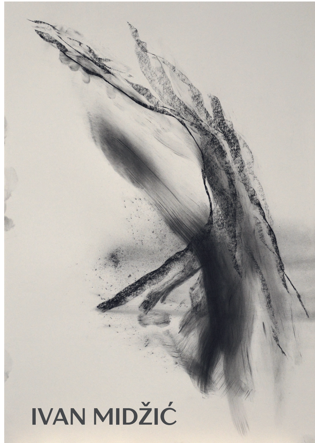
na naslovnici: Bez naziva, 2025. pastel, 100 x 70 cm