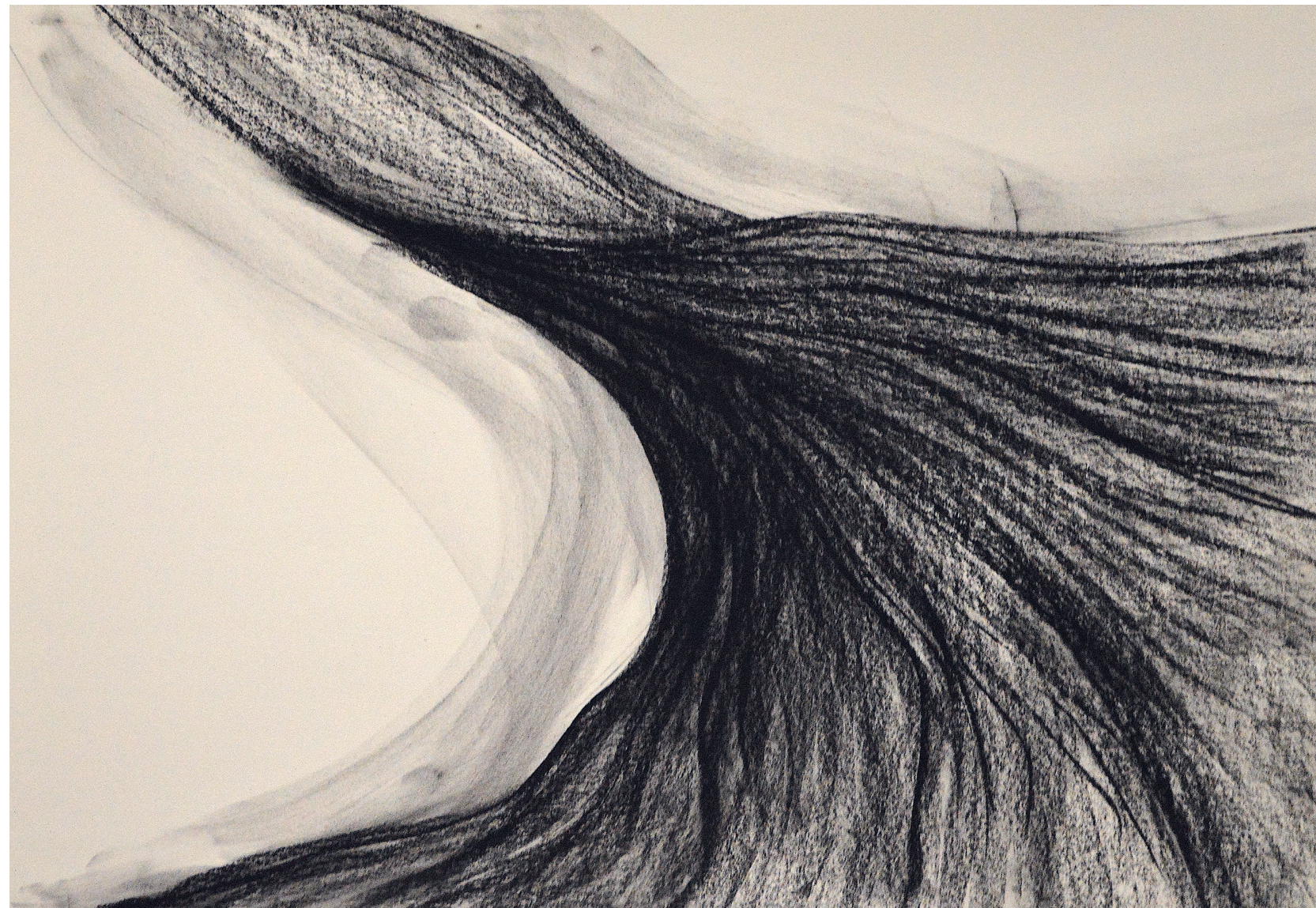
Drvena spirala, 2023. pastel, 70 x 100 cm